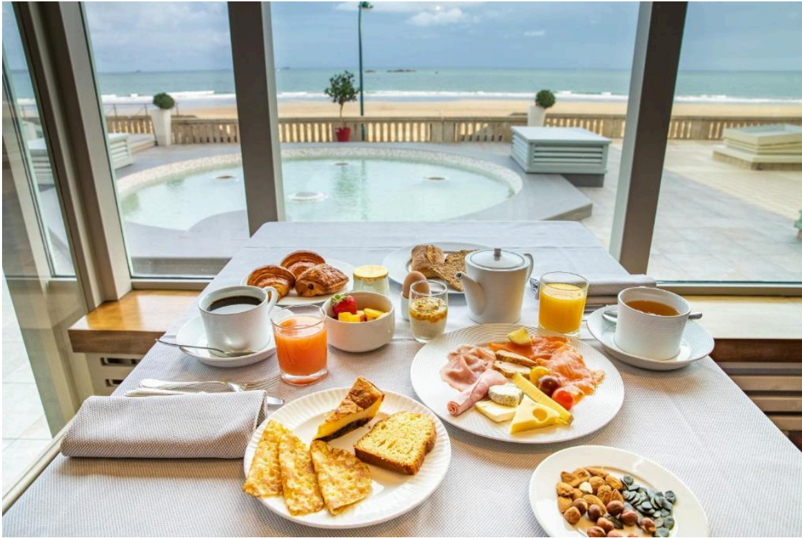
Salle de petit déjeuner

Saint Malo samedi 28 et dimanche 29 septembre 2024