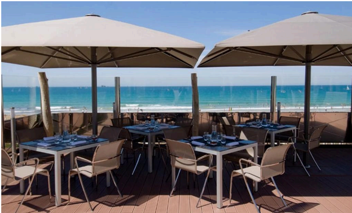
Terrasse de l'Hôtel